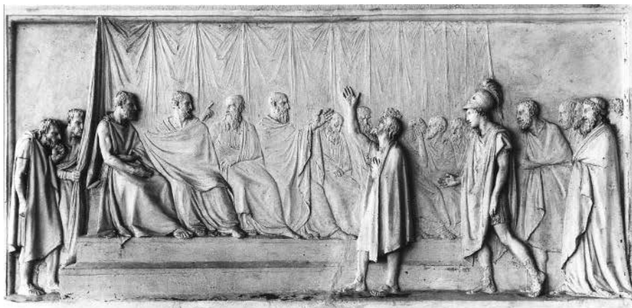
Канова А. Сократ, защищающийся в суде. Конец XVIII в. Гипсотека Кановиана, Поссаньо.

Судебный процесс против Сократа возбудили трое: молодой и честолюбивый посредственный трагический поэт Мелет; владелец кожевенных мастерских Анит, являвшийся влиятельным лицом в демократической партии и заклятым врагом софистов, к которым он причислял Сократа; а также оратор Ликон. Текст обвинения гласил: «Это обвинение написал и клятвенно засвидетельствовал Мелет, сын Мелета, пифеец, против Сократа, сына Софрониска из дома Алопеки. Сократ обвиняется в том, что он не признает богов, которых признает город, и вводит других, новых богов. Обвиняется он и в развращении молодежи. Требуемое наказание — смерть». Важно понимать, что под обвинением в развращении молодежи имелось в виду исключительно поощрение юношеского бунта и сыновнего непослушания.