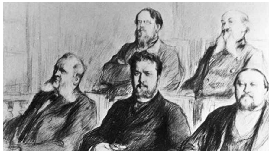
Пастернак Л.О. Присяжные заседатели.

Суд присяжных включал в себя две коллегии. В состав первой входило не менее трех судей: председатель и члены суда – коронные судьи. Вторая же коллегия состояла из двенадцати присяжных заседателей.