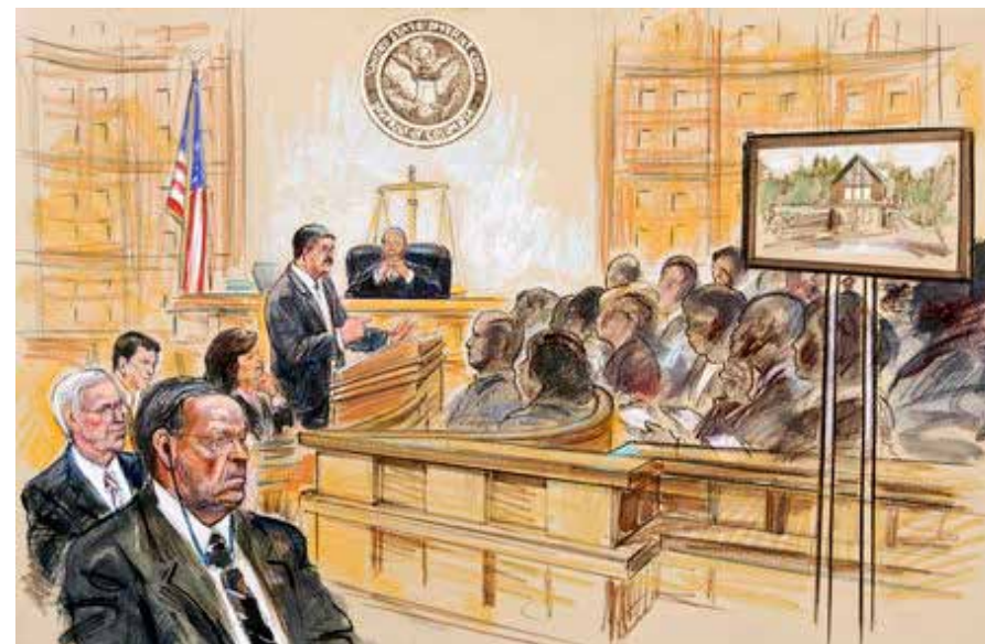
Обвинитель обращается к присяжным. Зарисовка из зала суда. США.

Характерной чертой американской модели института присяжных является подготовка к судебному процессу, – краткий курс обучения,