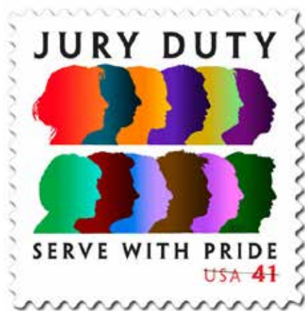
«Долг присяжного». Почтовая марка, США, 2007 г

некоторых поселений в штате Вайоминг, основанных сбежавшими рабами и скрывавшимися от правосудия преступниками, женщины привлекались к работе в качестве присяжных в связи с острой нехваткой надежных граждан. Сегодня ограничения, связанные с полом, расой и достатком потенциальных присяжных уже сняты, однако и в настоящее время окончательный состав жюри иногда бывает представлен гражданами только одного пола.