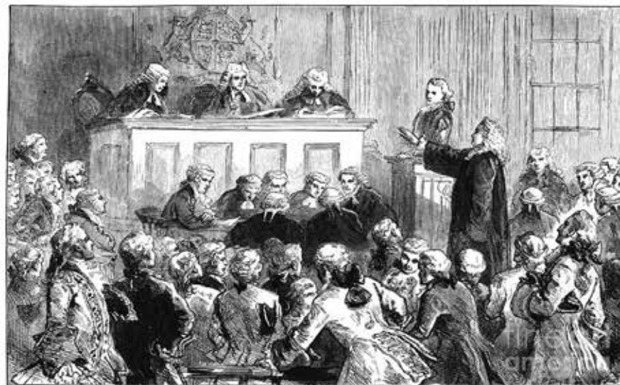
Эндрю Гамильтон защищает Джона Зенгера в суде. 1734-5.

После смерти королевского губернатора Нью-Йорка Джона Монтгомери в июле 1731 года, новым губернатором был назначен