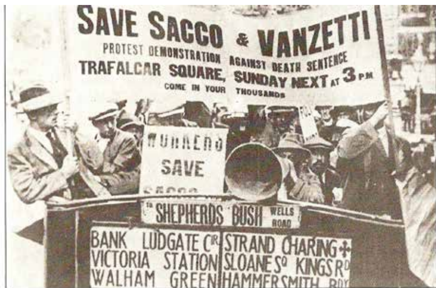
Протесты в Лондоне, 1921

цать лет один из свидетелей защиты признался, что дал ложные показания по просьбе анархистской организации Бостона, но и среди свидетелей со стороны обвинения было немало граждан, набранных из агентов полиции.) Присяжным не оставалось ничего, кроме как основывать свое мнение на иных доказательствах. Показания приглашенных экспертов также не были однозначными и не обеспечивали полную победу ни одной из сторон. Наибольшее влияние на присяжных оказали результаты баллистической экспертизы, представленной стороной обвинения, согласно которым пуля, извлеченная из тела телохранителя кассира, была выпущена из револьвера, найденного у Сакко. Приговор, вынесенный 14 июля 1921 года, не был неожиданным: после пятичасового обсуждения присяжные признали подсудимых виновными.