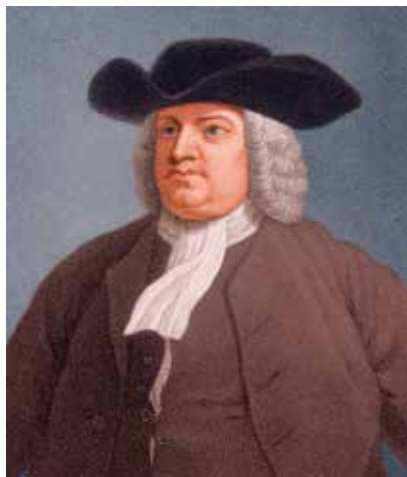
Уильям Пенн. Иллюстрация из Новой международной энциклопедии. 1920.

Став убежденным квакером, а затем и квакерским проповедником, Пенн печатал религиозные сочинения и памфлеты, был неоднократно арестован, но никогда не переставал ратовать за свободу вероубеждений, которая могла быть достигнута только в рамках официальной политики веротерпимости. Будучи прагматичным юношей, Пенн защищал своих соратников по вере, используя официальные каналы, судебные заседания и политические рычаги. Находясь в длительном заключении в лондонском Тауэре, Пенн написал свое самое известное сочинение в защиту квакерства: «Ни креста, ни короны», восхваляющее идеалы аскетизма, добродетели и социальных реформ. Трактат, содер-