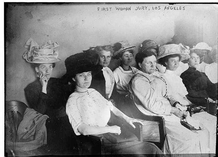
Первое жюри присяжных, состоявшее из одних женщин. США. 1911.

В США, в отличие от Англии, институт суда присяжных имеет несравнимо большую ценность. «Ввезенный» британскими колонистами в XVIII веке, суд присяжных фактически стал основой американской юриспруденции. Получив законодательное закрепление в Билле о правах 1791 года, институт присяжных заседателей продолжил наращивать и популярность, и значимость. Изначально присяжными заседателями могли стать лишь белые люди, т.е. представители европейского населения, и только мужчины, владеющие землей, в то время как женщины, темнокожие граждане и неимущие слои населения к исполнению обязанностей присяжных не допускались. Несмотря на то, что участие женщин в работе американского суда присяжных стало возможным лишь в начале XX века в ряде штатов и получило полное закрепление только в 1975 году, уже в конце XIX века в