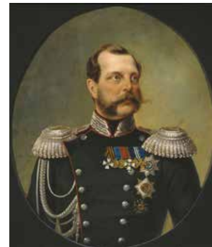
Лавров Н.А. Император Александр II Освободитель. 1868. Артиллерийский музей, Санкт-Петербург.

Для решения задач, которые были поставлены императором перед системой правосудия, и осуществления намеченных целей, и была проведена реформа 1864 года, которая внесла значительные изменения в судопроизводство царской России. Впервые в Уставе уголовного судопроизводства были закреплены принципы осуществления правосудия только судом, основанном на принципах гласности, законности, самостоятельности судебного процесса, независимости суда от местных представителей власти, несменяемости судей. Реформой также был заложен один из основополагающих принципов правосудия, в соответствии с которым все являлись равными перед законом и судом. Новые судебные органы рассматривали и уголовные, и гражданские дела всех подданных империи, вне зависимости от их сословия.