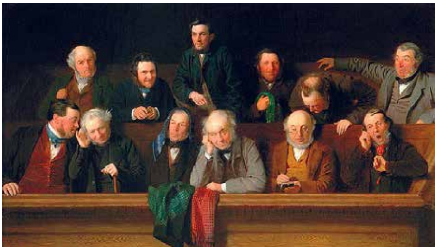
Морган Д. Присяжные. 1861. Музей округа Бакингемшир, Эйлсбери.

обоснованно громоздким и чрезмерно длительным. Кроме того, практика показала, что присяжные зачастую исполняют свои обязанности недобросовестно, или имеют предубеждения в отношении определенных категорий дел.